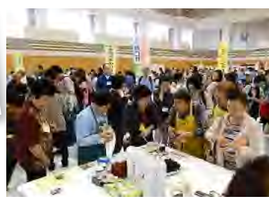
※過去に開催した大交流会の写真です。