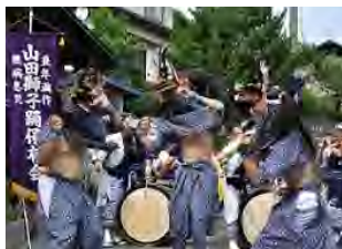
山田獅子踊り (山田獅子踊り保存会)